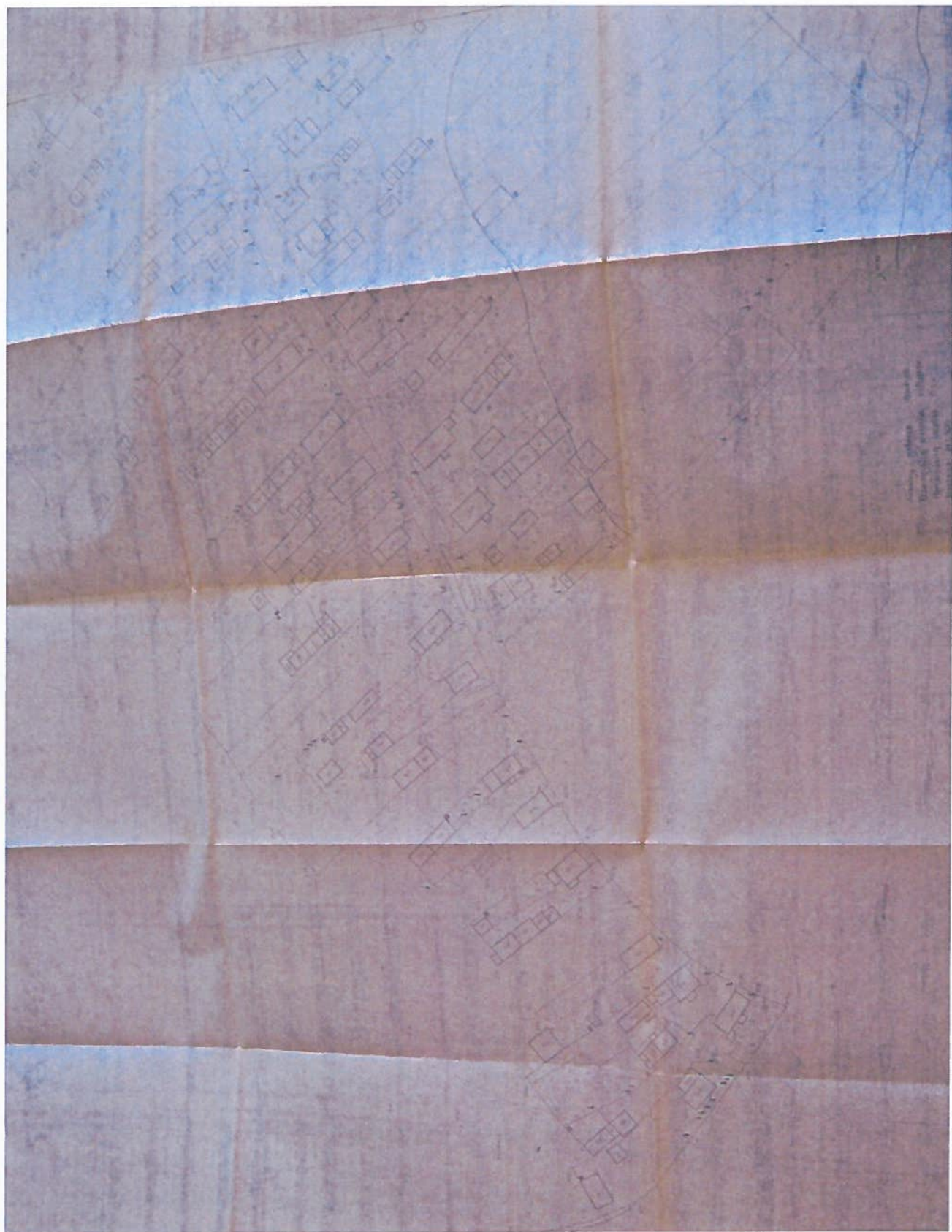
Br. Nr. 1 Centrinė Čižiūnų kaimo dalis. Iš Varėnos r. Valkininkų ap., Čižiūnų k. centrinės, šiaurinės ir pietinės kaimo dalių sodybu topografiniai planai, 1977. Vilniaus apskrities archyvas, f. 1019, ap. 11, b. 1659;