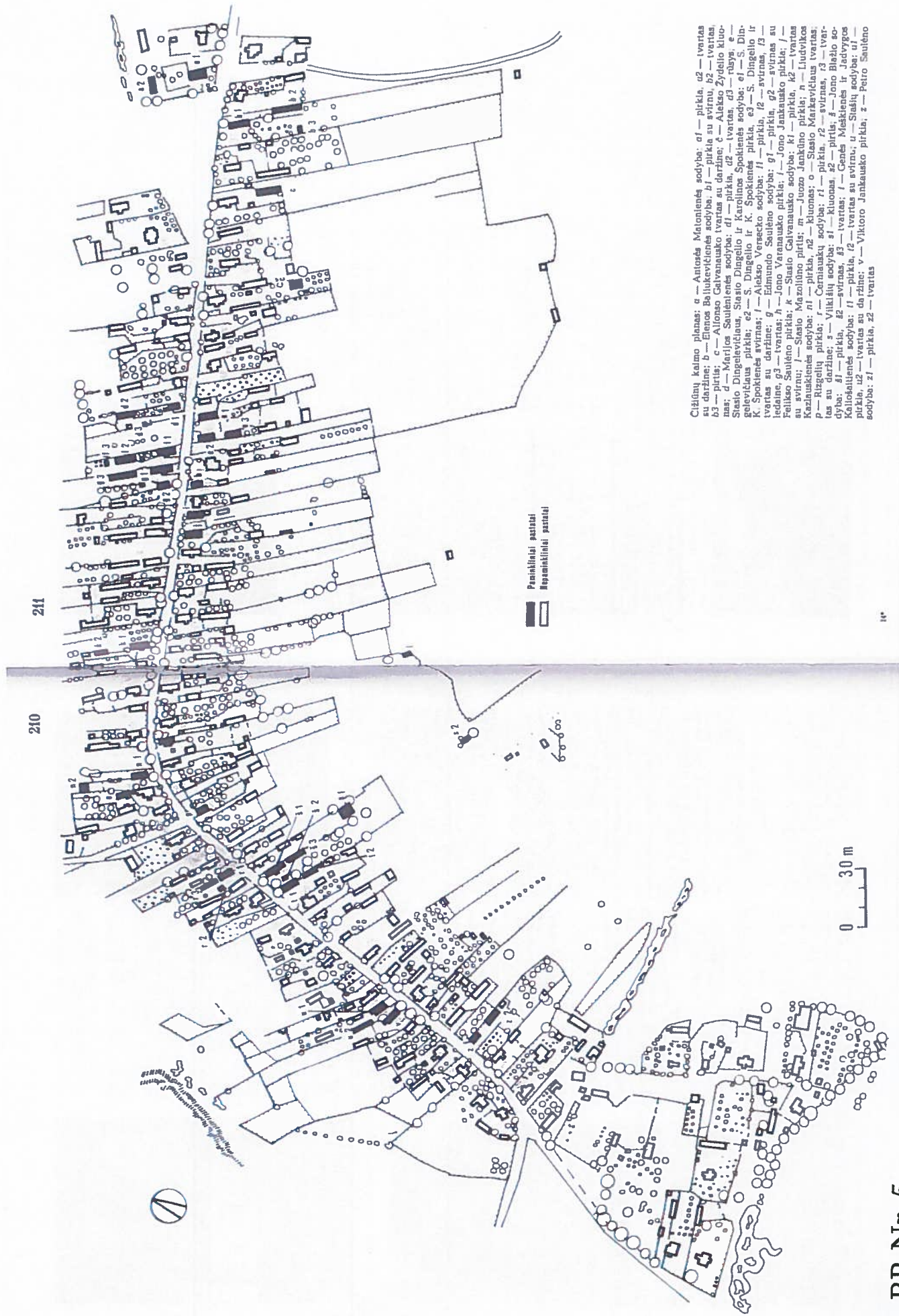
BR Nr. 5 Čižiūnų kaimo planas. Iš Kultūros paminklų enciklopedija. Rytų Lietuva. Vilnius, 1998, t. 2.